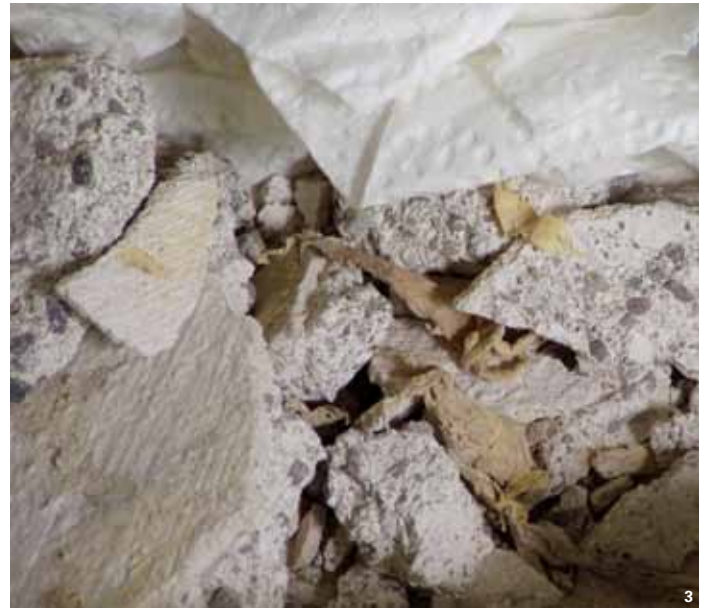
3 Ein Tatort: Mauermaterial und uncharakteristische Myzelreste für die DNA-Analyse.

Holzforschung Austria erarbeiteten molekularbiologischen Nachweismethoden erfassen vier wichtige Vertreter der Hausfäule. Der Echte Hausschwamm ( Serpula lacrymans ), der Wilde Hausschwamm ( Serpula himantioides ), der Weiße Porenschwamm ( Antrodia vaillantii ) sowie der Braune Kellerschwamm ( Coniophora puteana ) können anhand ihrer „genetischen Fingerabdrücke“ erkannt werden.