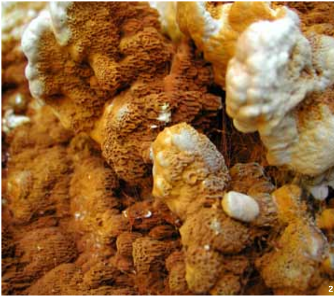
2 Ein Übeltäter: Der charakteristische Fruchtkörper eines Hausschwamms.